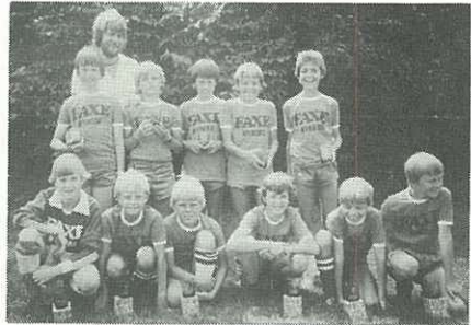
Fjordagers 2. Lilleput der blev nr. 3.