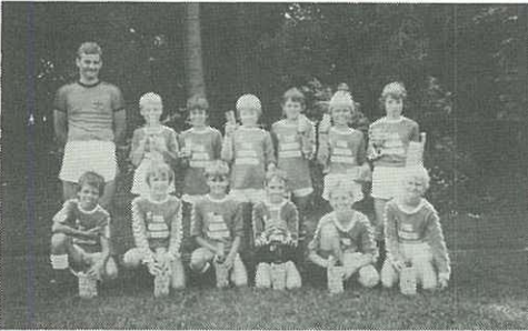
Dalums 2. hold der vandt vores Lilleputstævne.