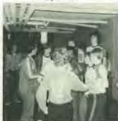
Indtryk fra 1. pige- og drengeholdes tur til Tarm.