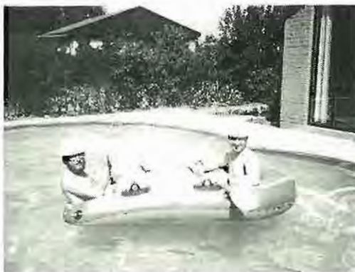
Redaktørerne holder ferie!!!